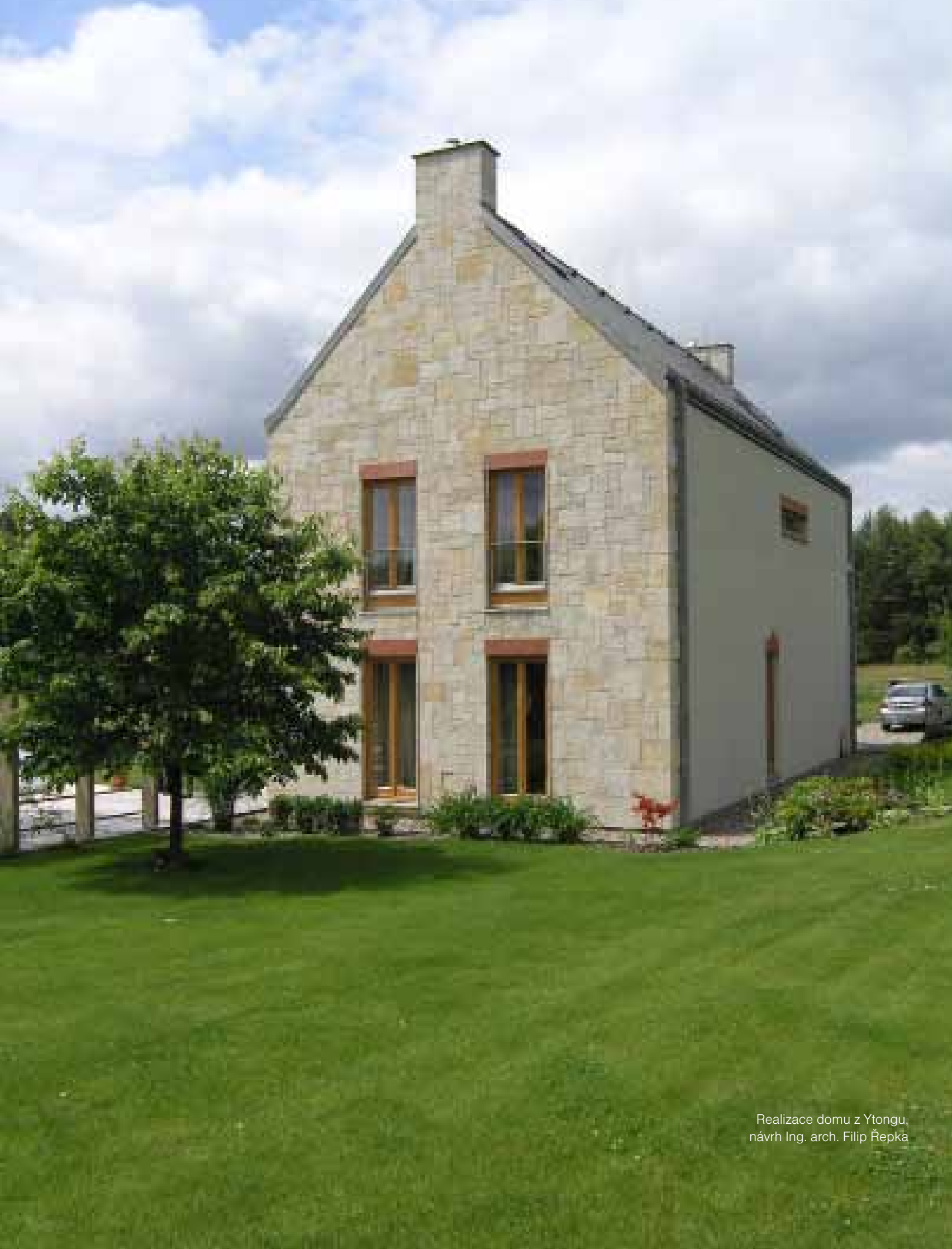
Realizace domu z Ytongu, návrh Ing. arch. Filip Řepka