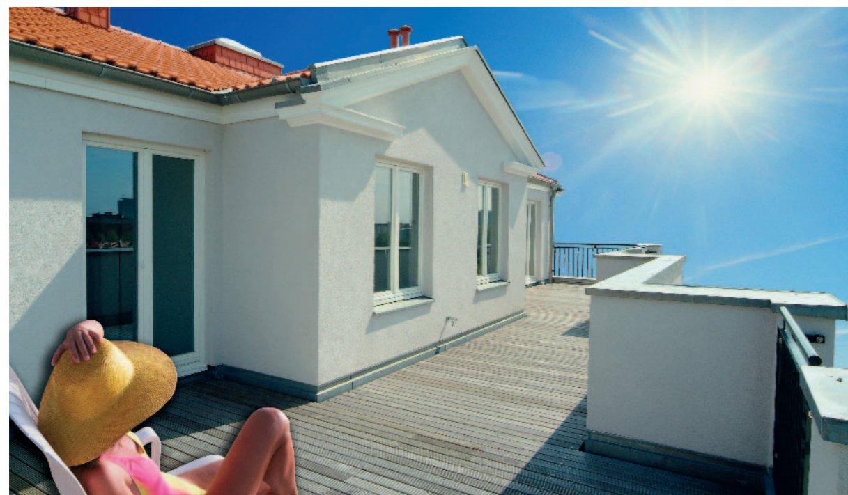
Nízká hmotnost zdiva a výjimečné izolační schopnosti se plně uplatňují u nástaveb a přístaveb starších domů.

Tím, že odpadá potřeba vnějšího zateplení, výrazně se zjednodušuje projekt i realizace nástaveb. Nové zdivo je možné plynule navázat na stávající obvodové stěny a jednoduše napojit i povrchové fasádní úpravy.