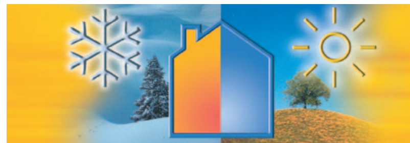
Nástavby z pórobetonu Ytong P1,8-300 jsou zárukou pohodlí v zimě i při letních vedrech.