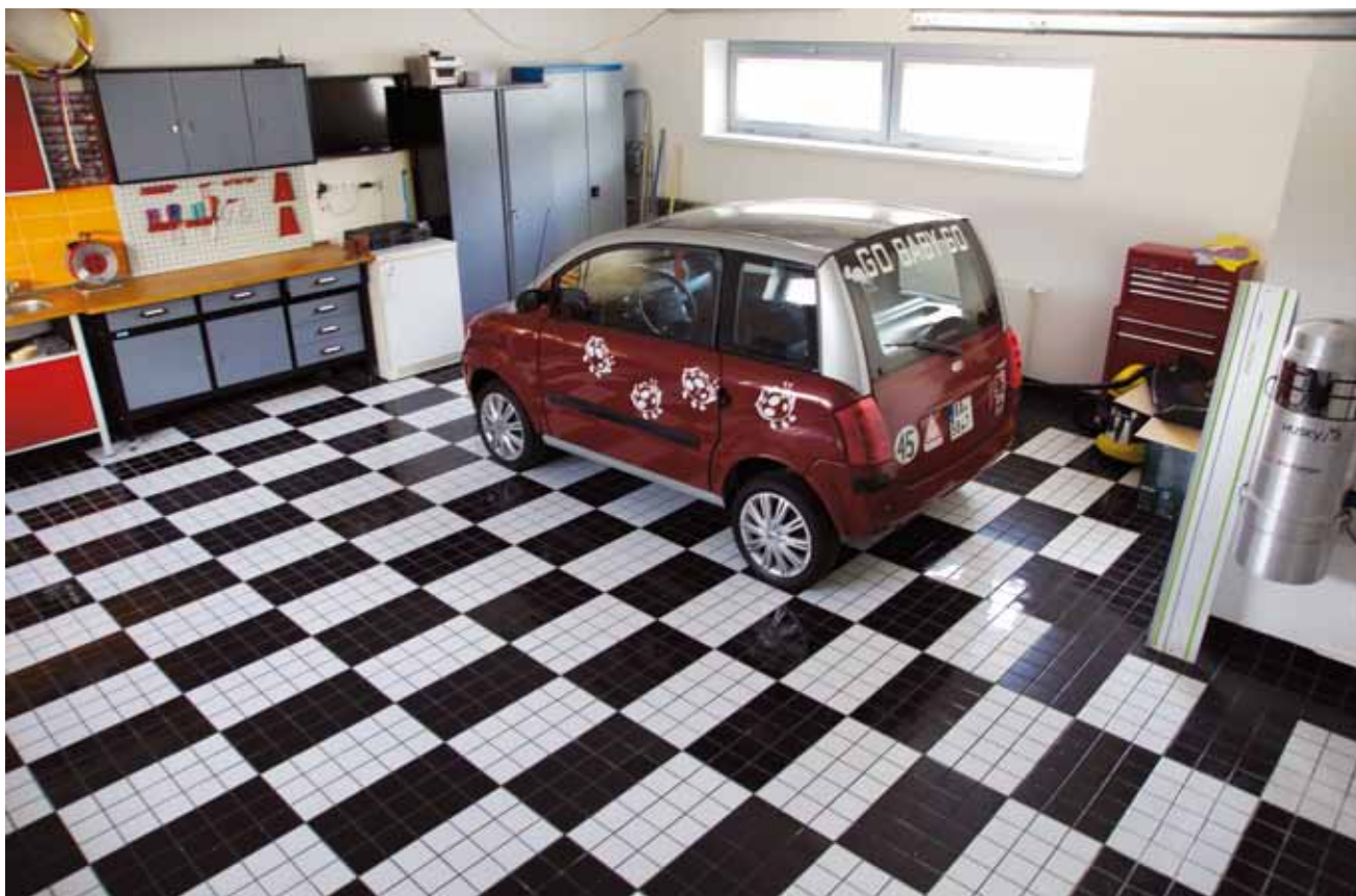
Do zajímavě řešené garáže v přízemí domu se běžně vejdou dva závodní speciály. Garáž slouží i jako společenská prostora pro setkávání s přáteli, kteří mají stejně jako majitel vášně pro sportovní vozy. V době naší návštěvy zde parkovalo jen vozítko dcery.

sem automobilových závodů, pobavíme se, popracujeme i pokoukáme, proto je i v garáži na stěně televize a nechybí ani malá kuchyňská linka s dřezem a lednice," vysvětluje majitel. Snaha využívat i zdánlivě ztrátové chvíle během přípravy jídla v kuchyni nebo v průběhu očisty jej vedla k tomu, že na televizi v obývacím pokoji je bezvadný výhled od kuchyňské linky a obrazovka nechybí ani ve velké koupelně. „Televize standardně vyráběné do koupelen neumožňují nijak kvalitní podívání, a tak jsem přemýšlel, jak to udělat. Řešení je docela jednoduché: do stěny jsme vyřízli otvor příslušných rozměrů, pomocí lišt jsme do otvoru zabudovali promítací okno, jaké se používá v kinech, LED televize je za sklem v sousedním prostoru šatny a reproduktory jsou přes počítač vytaženy nahoru nad lištu s osvětlením," popisuje.