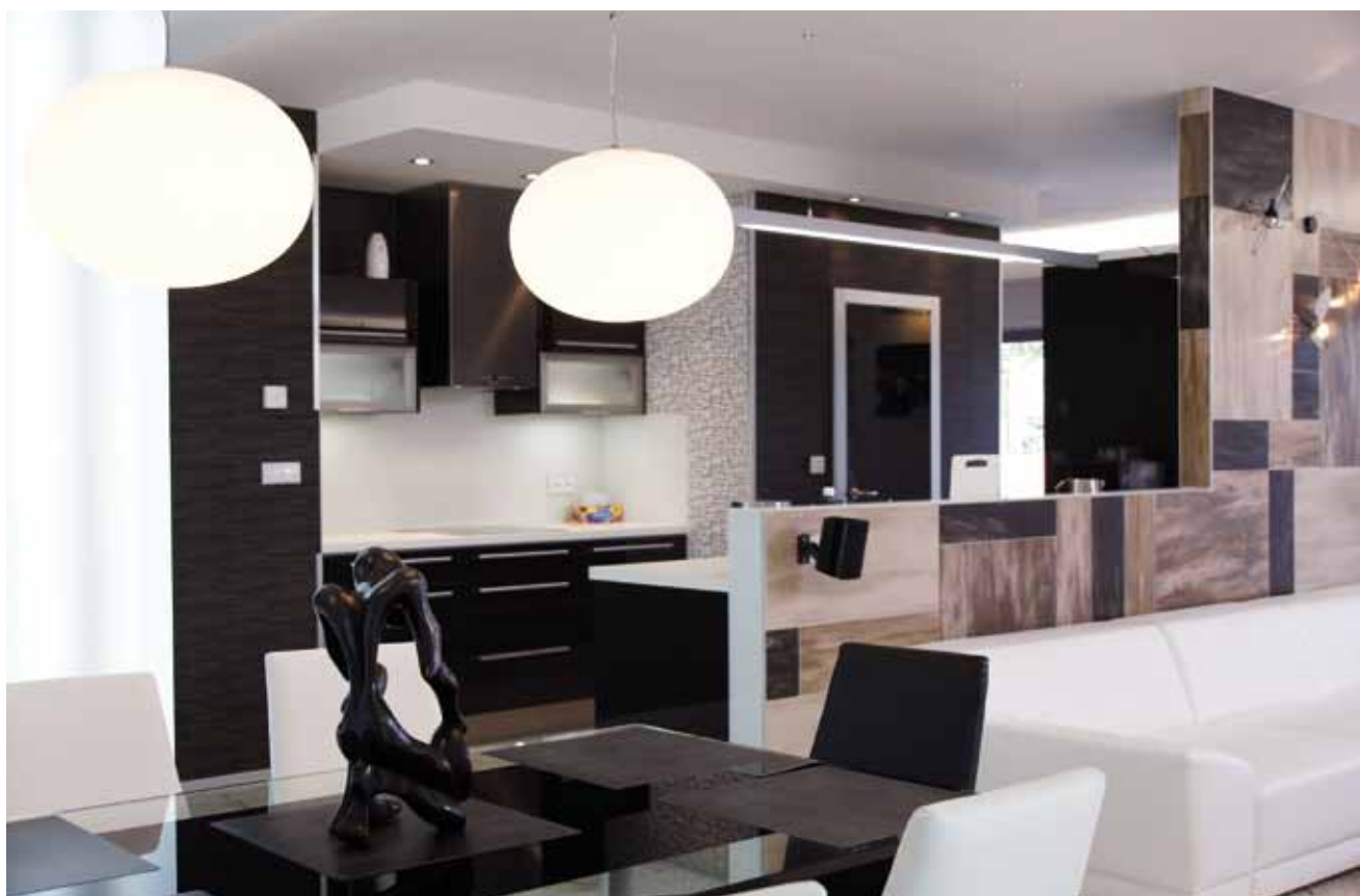
Prizemí domu je koncipováno jako velký otevřený prostor, kde se díky převaze světlých odstínů italských mramorových obkladů a keramiky i velkorysému osvětlení cítíte velmi příjemně.