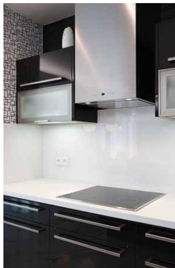
V kuchyňské zóně jsou dvě pracovní desky. Jejich povrch majitel vybral v souladu s ostatním zařízením.

Dům je jednoduchý. Má dva vchody – jeden zepředu od klidné silnice a chodníku, druhý zezadu od zahrady, přesněji od parkovacích stání. Tento vchod je zároveň přístupem z domu na severovýchodní terasu vyvýšenou necelý metr nad zahradou. V přízemní společenské části se nachází kuchyň, kterou linka s pracovní deskou a částečně i mramorem obloženou stěnou odděluje od prostorného obývacího pokoje. V jeho postranní části mezi dvěma nosnými sloupy, jejichž ocel je skryta efektně odlehčujícím diodovým osvětlením, je pamatováno i na jídelní zónu. V zákrytu za stěnou s mramorem jsou dveře do spížířny, vedle kterých ve výklenku je další kuchyňská linka s varnou sklokeramickou deskou, v tomto případě včetně horních skříněk s digestoří. V přízemí je dále prostorná šatna, předsíň, menší z koupelen s toaletou včetně zákoutí na praní a velkoryse pojatá dvojgaráž.