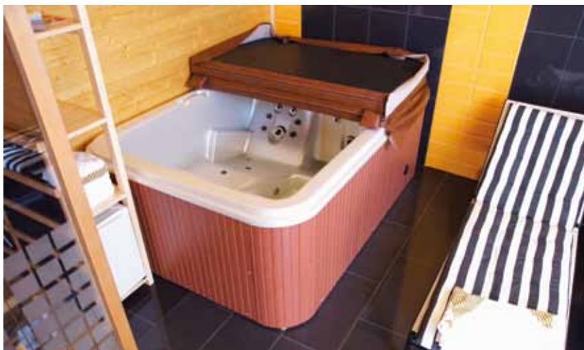
Do jednoho z rohů zahrady je situováno wellness centrum vybavené vířivkou, saunou, odpočívárnou i topením v podlaze. Interiér domečku vyrobeného na míru voní dubovým dřevem.