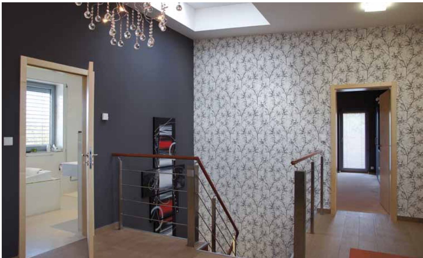
Chodba v patře je průsečíkem tří pokojů, jedné prostorné šatny a velké koupelny, ale z několika důvodů se tu necítíte jako v neútulném prostředí nikoho. Příjemnou atmosféru sem vnáší světlo ze střešního světlíku, elegantní lustr, dekorace na stěnách i samotný fakt, že u stolu s regály je pracovna majitele (mimo úhel záběru).