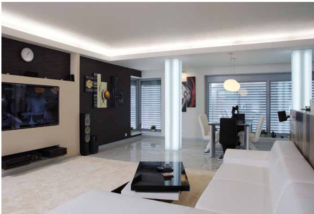
Televize v obývacím pokoji je umístěna hned vedle biokrby. Jednoduchým manuálním úkonem ji lze vysunout ze stěny a přiblížit či požadovaným úhlem nasměrovat k divákům na sedačce. Pocit luxusu korunuji mocné sloupy odlehčené LED diodovým osvětlením