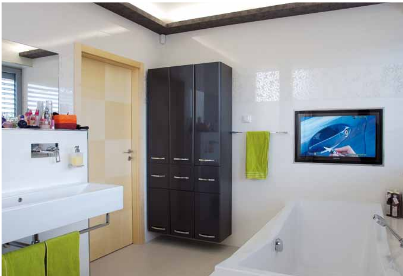
Velká koupelna v patře je vybavena pohodlnou vanou i sprchovým koutem. A když je venku zrovna nečas, netřeba podléhat depresím – do stěny rafinovaně zabudovaná LED televizní obrazovka vás přivede na jiné myšlenky.