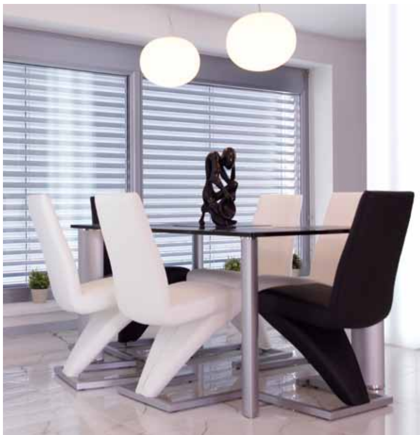
Noblesní ráz jídelní zóny má základ v bílo-černé kombinaci doplňků, jako jsou židle, stůl s deskou z masivního skla i skulptura na něm, kterou si majitel přivezl z Kapverdských ostrovů.