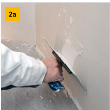
Nanášení stěrky ocelovým hladítkem